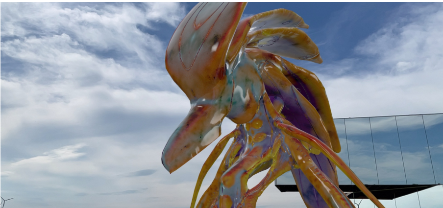
Mélodie Mousset & Marta Stražičić, Shhhhhaaaaa, 2022, AR, Installationsansicht vor der SPIEGEL|ARCHE, 2022, © Mélodie Mousset & Marta Stražičić