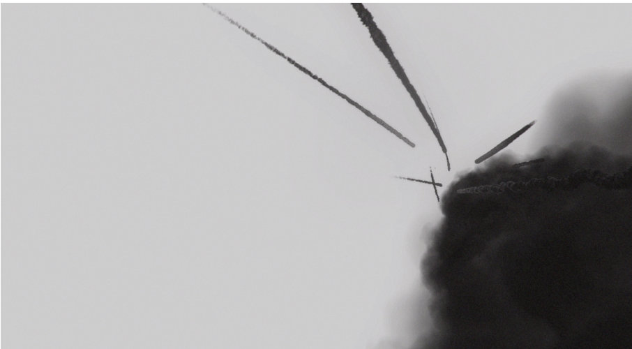
A/A, A/DOOM, 2022, VR-Installation, Installationsansicht 2022, © A/A