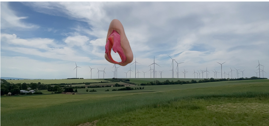
Anne Duk Hee Jordan, Diddle My Skittle, 2022, AR, Installationsansicht vor der SPIEGEL|ARCHE, 2022, © Anne Duk Hee Jordan