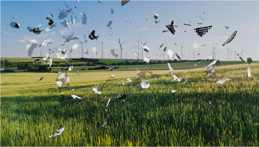
Benedikt Terwiel, Hubris Debris, 2022, AR, Installationsansicht vor der SPIEGEL|ARCHE, 2022, © Benedikt Terwiel