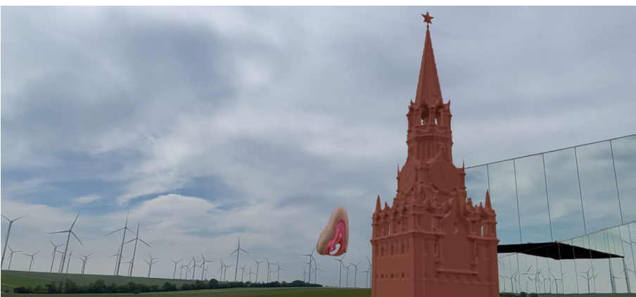
Anne Duk Hee Jordan, Diddle My Skittle, 2022, AR, Installationsansicht vor der SPIEGEL|ARCHE, 2022, © Anne Duk Hee Jordan