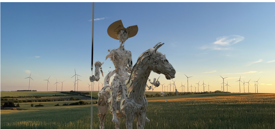
Dennis Rudolph, Don Quijote, 2022, AR, Installationsansicht vor der SPIEGEL|ARCHE, 2022, © Dennis Rudolph