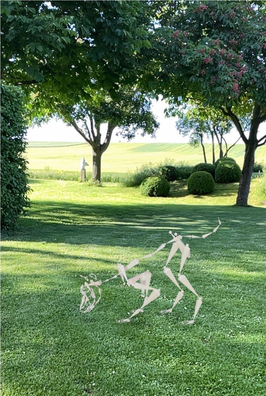
Benedikt Terwiel, New Habitas, 2022, AR, Installationsansicht vor der S P I E G E L | A R C H E, 2022, © Benedikt Terwiel